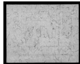
Rückseite der neuen Faser-ATM

Die ATM in dieser Liste werden getrennt von anderen Bestellungen ausgeliefert: